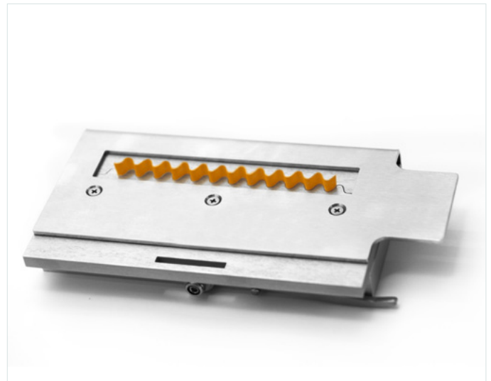
Concora Crush Test (CCT)