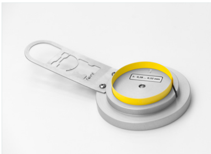
Ring Crush Test (RCT)